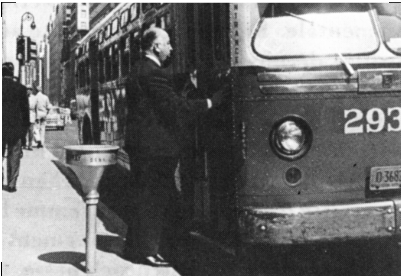
Alfred Hitchcock Con la muerte en los talones 1959

regula así en 1959 una parte de los conflictos entre la diégesis ficticia y la realista en el cine y en la televisión. La TV no ha conocido verdaderamente este problema de diégesis, siendo ella misma el lugar del cual se habla, es decir, el canal de su propia difusión, el que la garantiza en tanto en cuanto es un lugar de poder. La particularidad del guest star system televisivo se acerca a su manera al problema de la aparición en el caso de Laurette. La invitación de Warhol a un episodio de Vacaciones en el mar es en este sentido revelador, puesto que el artista es invitado para revelar otros umbrales de visibilidad de sí mismo (de su imaginería), de lo que representa (una imagen), de lo que garantiza (un éxito). “¿A quién le interesan, pues, las imágenes de la televisión?” 21 .