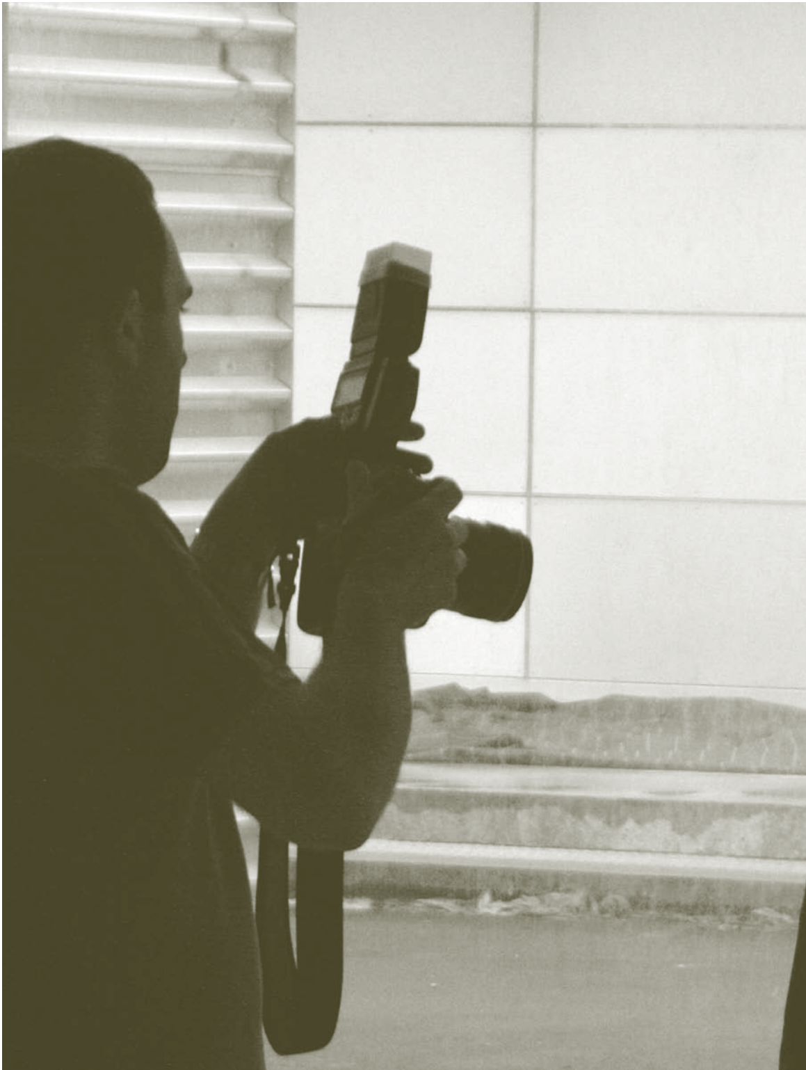
↑ Telenouvelle Basque tailerra, Artelekun. [Aitor Bengoetxea]